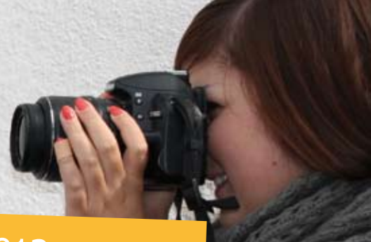
Foto- und Filmworkshop